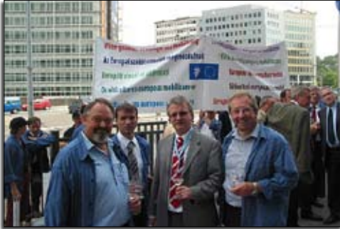
Michael Gahler mit Vertretern der hessischen Weinbauverbände in Brüssel

Deutsche Winzer haben kurz vor der Sommerpause in Brüssel gegen die Vorschläge der Europäischen Kommission zur EU-Weinmarktreform protestiert und Bundesminister Seehofer am Rande der Ratssitzung hierzu ein Positionspapier überreicht.