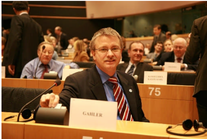
Michael Gahler kurz vor seiner Wahl zum stellvertretenden Vorsitzenden des Auswärtigen Ausschusses des Europäischen Parlaments am 31. Januar 2007 in Brüssel

Zukünftig werde ich als stellvertretender Vorsitzender des Auswärtigen Ausschusses die außenpolitischen Positionen des Europäischen Parlaments an führender Stelle mit erarbeiten dürfen. Dies ist eine große Verantwortung, schließlich steht Europa nicht erst heute vor komplexen Herausforderungen.